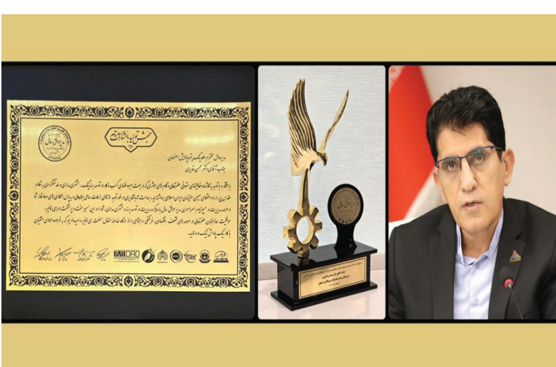
مدیرعامل فولاد مبارکه در جمع خبرنگاران از

امکان استفاده شرکت های استان های هم جوار فولاد مبارکه از گمرک اختصاصی این شرکت