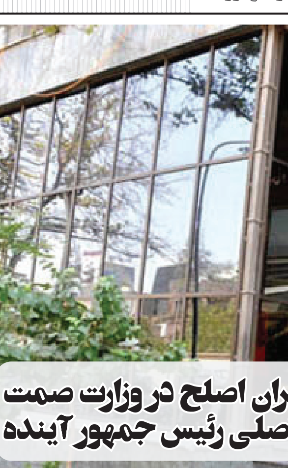
وزارت صنایع و معادن در تهران

موسسه غیر دولتی عام المنفعه با سابقه یک ساله و مدرک کارشناسی ارشد و بدون حتی یک روز فعالیت در ادارات دولتی و فاقد هر گونه تجربه تولید و صنعت، قبل از انجام فرایندهای اداری و ابلاغ ماموریت، با حکم وزیر سابق صمت به عنوان معاون وزیر منصوب گردید که در حال حاضر با ورود نهاد نظارتی، ماموریت نامبرده غیر قانونی تشخیص داده شده و پرونده تخلف آن در مرحله اجرایی قرار گرفته است. سوال اساسی این است که تکلیف تصمیمات و دستورات و اقدامات این معاون فاقد جایگاه قانونی وزیر صمت در زمان تصدی مسئولیت و در حال حاضر چیست و چه کسی پاسخگوی عملکرد غیرقانونی این معاون وزیر می باشد؟ در گذشته نیز یکی از مدیران همین معاونت در اقدامی بی سابقه، با حمایت های صورت گرفته همزمان مسئولیت یکی از دفاتر تخصصی وزارت صمت و ریاست هیات مدیره یکی از شرکت های تولیدی دارویی مرتبط را بر عهده داشت و یا در موردی دیگر، یکی از مدیران مأمور دیگر ایشان با وجود تصدی مدیریت یکی از دفاتر تخصصی، همزمان سرپرستی ستاد دخانی را نیز بیش از ۱۰ ماه است که بر عهده دارد که ریشه این انتصابات غیر قانونی عمدتا در زمان تصدی وزیر سابق صمت صورت گرفته و جای تاسف است که در زمان وزارت آقای علی آبادی نیز استمرار یافته که البته پیگیری های صورت گرفته حاکی از اعمال فشارهایی برای جلوگیری از جابجایی این نوع مدیران و به تبع آن بویایی آن وزارتخانه دارد. این در شرایطی است که کشور دارای مدیران توانمند در زمینه های تولیدی و بازرگانی می باشد که می توانند با استفاده از تجربیات ارزنده خود به جای اقدامات و یا مصاحبه های پوپولیستی و یا آمار سازی های غیر واقعی و برنامه های محرب، اقدامات اثر بخشی را برای کشور انجام دهند .